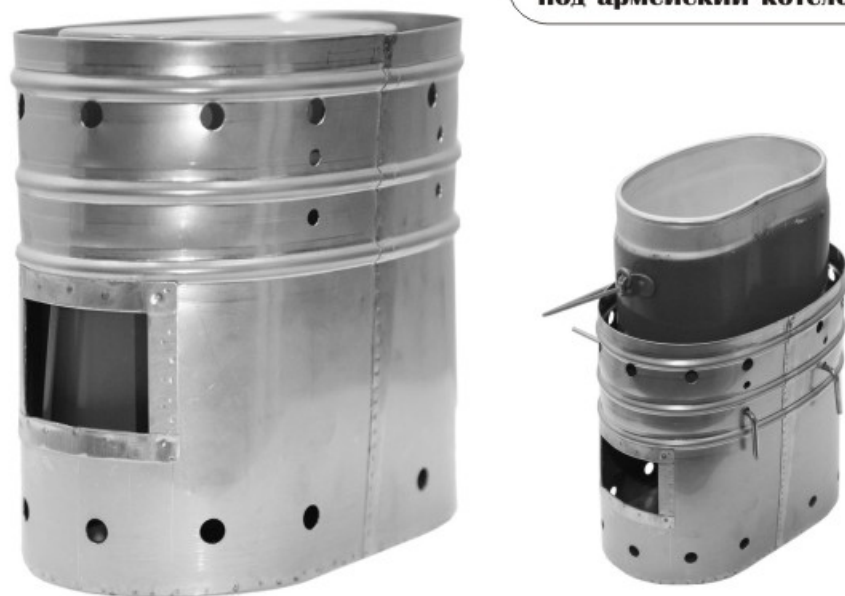
Печка щепочница Век под армейский котелок

Оригинальная, прочная печка - щепочница под армейский котелок, предназначена для приготовления пищи в походных условиях, на охоте и рыбалке. Это удобная, компактная печка, которая с легкостью заменит костер. Конструкция данной печки выполнена таким образом, что во время транспортировки армейский котелок вставляется в печку, а во время приготовления пищи котелок может устанавливаться на ограничители на разной высоте. Печка очень удобна для кипячения воды и приготовления пищи в армейском котелке. Главным преимуществом такой печки является то, что топливом служат мелкие ветки, шишки, щепки, сучки и т.д. Рекомендуется для охоты, рыбалки, походов и отдыха на природе.